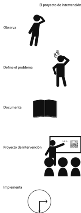
Figura 3: El Proyecto de intervención.

Para ello como segundo paso, es ineludible la delegación de tareas a los especialistas y como tercer paso, determinar y realizar las solicitudes específicas a los diversos proveedores de acuerdo a la temporalidad y de acuerdo a los recursos destinados para cada una de las acciones que se han determinado en el Proyecto de Intervención.