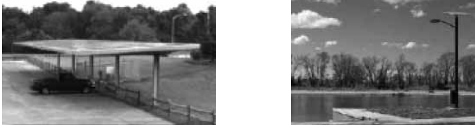
Figura 3: Sistema mixto de iluminación exterior (derecha). Sistema de energía fotovoltaica exterior (izquierda) Referencia: Material gráfico Arq. Cabeza ,Alejando, 2010.

Para el abastecimiento de electricidad en el Bioparque, se tomo la decisión de contar con un sistema mixto: para la zona administrativa y educativa se ocupara la red de la Comisión Federal de Electricidad y como complemento la utilización de energía fotovoltaica solar. En el caso de los módulos de servicios aislados o contenedores, se utilizará un sistema de energía solar renovable fotovoltaica en su totalidad.