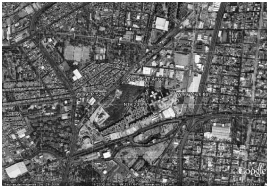
Figura 1: Localización-ubicación proyecto Bioparque Urbano San Antonio. Avenida Central no.300, Colonia Carola; Delegación Álvaro Obregón, Ciudad de México.