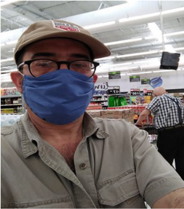
Imagen 1.- Al paso del tiempo nos hemos acostumbrado a realizar nuestras actividades de manera que se cumplan con los protocolos sanitarios que marcan las instituciones de salud a nivel local y federal.

Las fuentes que le nutren son diversas y numerosas, tanto la observación directa, como referenciada, recuperada de modo directo o de procedencia secundaria, y por su actualidad, debe de ser analizada cuidadosamente.