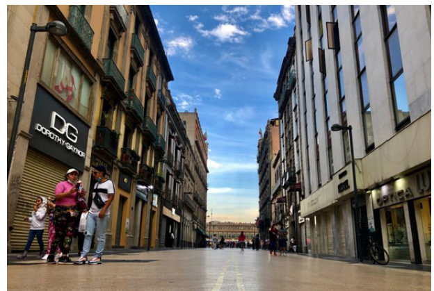
Imagen 2.- Comercios del centro de la Ciudad de México, cerrados durante la pandemia.

Tanto en tiempos de Covid-19 como en otros sucesos que han conmovido al país (la anterior crisis sanitaria del H1-N1, los terremotos de 1985 y de 2017), la sociedad civil, además de mostrar su solidaridad e interés en brindar apoyo, desde sus diversas posibilidades y capacidades, ha tenido un papel muy relevante, en donde el aspecto humano se ha hecho presente, y esta ocasión, aunque de manera diferente, no ha sido una excepción. Rebasando en muchas ocasiones a los esfuerzos que surgen de los más diversos ámbitos gubernamentales, tanto a nivel local como federal.