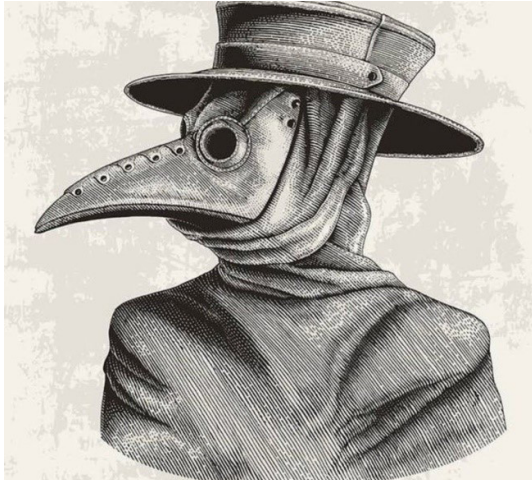
Imagen 5.- Mascara utilizada por los médicos durante el azote de la peste en Europa.