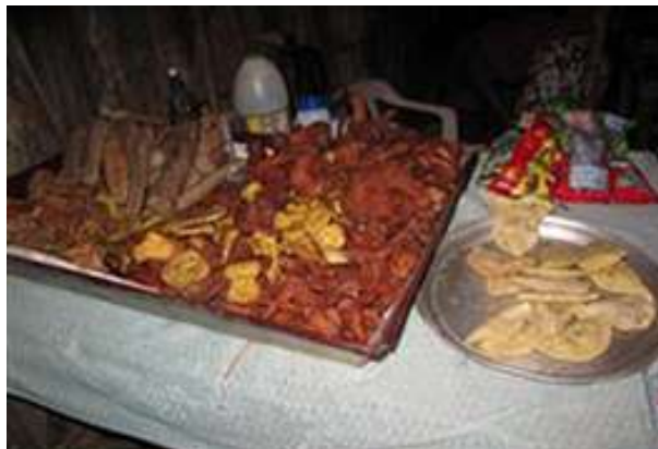
Imagen 2: Tejido de Esteras/ Productos cárnicos.