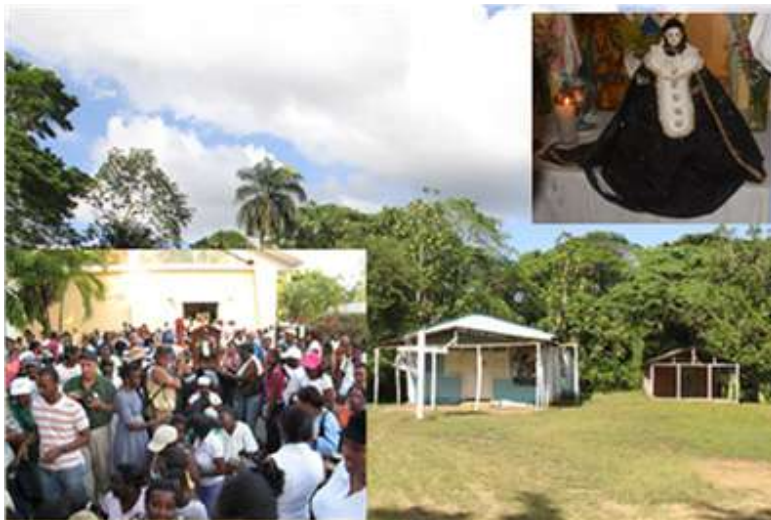
Imagen 1: Procesión y Ermita Nuestra Sra. De Los Dolores.

Especialmente en la época de cuaresma cuando es realizada una gran celebración, cuyos preparativos inician el Miércoles de Ceniza fecha móvil de acuerdo al santoral católico con la salida de la virgen en procesión recorriendo cerca de 17 kms, para permanecer allí un mes y regresar el Jueves Dolores con un recibimiento entusiasta que se extiende hasta el día siguiente, previo a la misma se efectúa un novenario. De acuerdo con Hernández 2016 "esa es una de las expresiones culturales tradicionales dominicanas que tiene más público, la cual aun siendo una comunidad súper pobre puede mantener una fiesta con tanta rimbombancia."