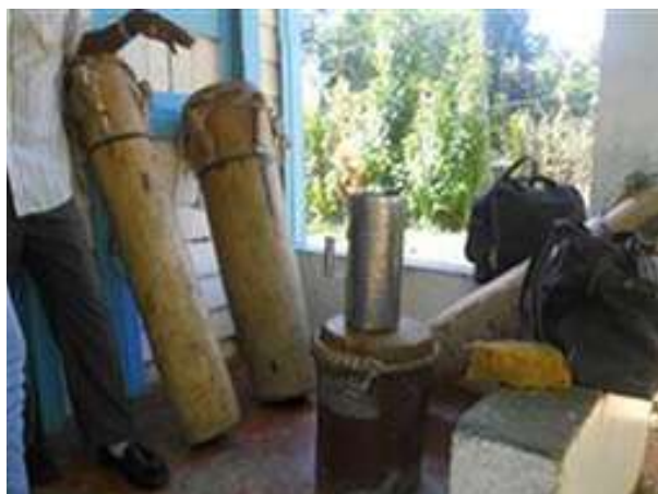
Imagen 3: Sr. Mauricio Mercedes (Interprete de Pri-Pri) e instrumentos tradicionales.

Es utilizada en sus ritos religiosos y en celebraciones seculares, dentro de lo que se destacan: Palos o cañutos, Salve, Pri-pri, Son y Congo. Aunque muchas de estas expresiones están extendidas en el país, en la comunidad existen características que les distinguen: los toques, la entonación, el acento del baile, la utilización de letras originales en las composiciones autorías de algunos de sus portadores, tienen exponentes magistrales y artesanos depurados en la construcción de instrumentos que son muy valorados dentro y fuera de la comunidad.