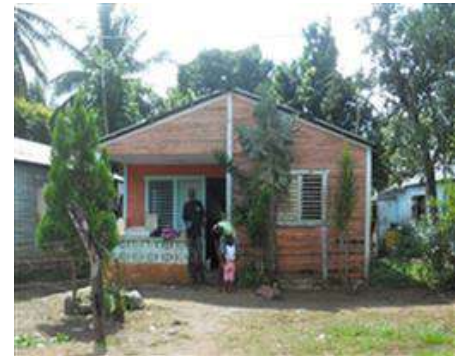
Imagen 2: Fachada frontal vivienda.

Sus viviendas están emplazadas en terrenos rodeados de la vegetación característica de la zona donde pueden habitar varios miembros de una misma familia, Sánchez destaca que "Los fundos son importantes porque unifican la familia, tanto en la herencia material como espiritual", por lo que son espacios determinantes para la devoción, y el sostén de las prácticas ancestrales. En este sentido Tejeda 2018, "la vivienda es un espacio sagrado en la que los elementos utilizados pueden tener una esencia simbólica" Son construidas con materiales de construcción ligeros, poseen una estructura modesta propia de la tipología de la vivienda rural común en la República Dominicana.