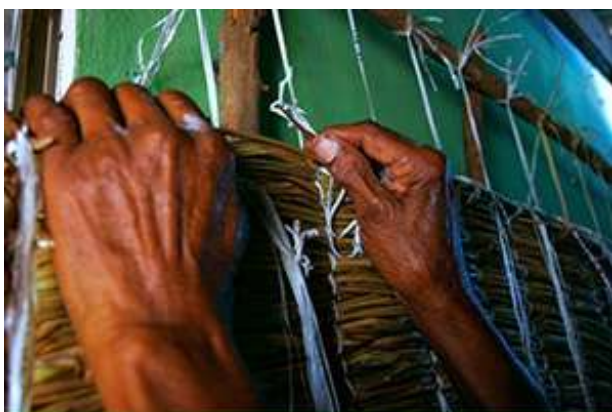
Imagen 2: Tejido de Esteras/ Productos cárnicos.

En el desenvolvimiento de la vida cotidiana los objetos artesanales son utilizados con una connotación espiritual, simbólica o ceremonial, o con fines utilitarios, estéticos y comerciales, dependiendo del interés y la necesidad del grupo social, constituyendo un medio para impulsar el desarrollo local. En el caso de Los Morenos tiene en su entorno todo lo necesario para la fabricación de objetos artesanales de una manera sostenible, con técnicas tradicionales en diferentes áreas.